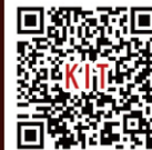
図 1. フォトリフラクティブポリマーを用いた書き換え可能ホログラムと動画 (QRコード)