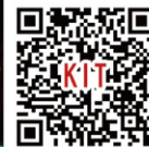
図 2. フォトクロミック色素を用いた書き換え可能ホログラムと動画 (QRコード)