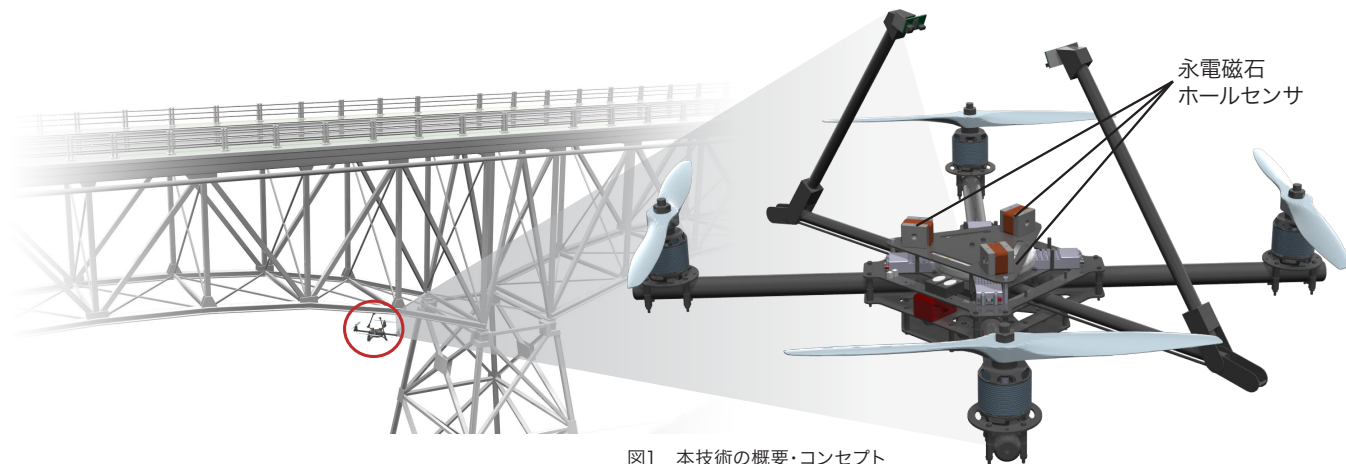
図1 本技術の概要・コンセプト

社会インフラの老朽化による検査ニーズの高まりと、労働人口の減少も相まって、ドローンなどによる無人・遠隔での検査が注目を集めています。バッテリー駆動によるドローンの飛行時間は短いため、本格的な橋梁の検査などでは、磁石で鉄板にドローンを固定することが理想的です。そのためには、電気信号を一度流せば磁石のオンオフが可能な永電磁石が想定されますが、永電磁石はその性質上、対象に接触する前にオンにすると十分な吸着力が得られません。そのため、対象物と磁石を近づけ、吸着させ、そして十分な保持力があるかを検出する必要があります。本特許はこれを実現する検出法、およびその装置となっています(図1)。