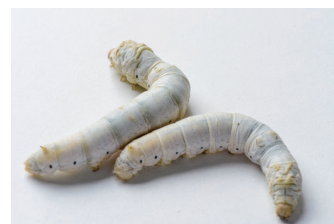
図2. 無細胞タンパク質合成系で使用するカイコガ

また、現在、無細胞系で市販されているものには、大腸菌、小麦胚芽、ウサギ赤血球、昆虫培養細胞を利用したものが、それぞれの特徴をもってありますが、どれも実験室レベルで使うにしても高コストである問題があります(表1)。カイコガ絹糸腺抽出液を使う本技術では(図2)、将来的にコストを数分の1~10分の1程度に抑えられることが期待されます。